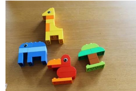
Hoe werken ze samen?