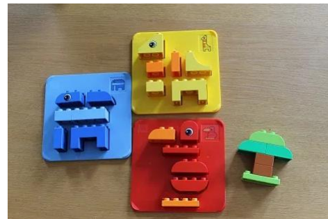
Waar zijn ze voor?