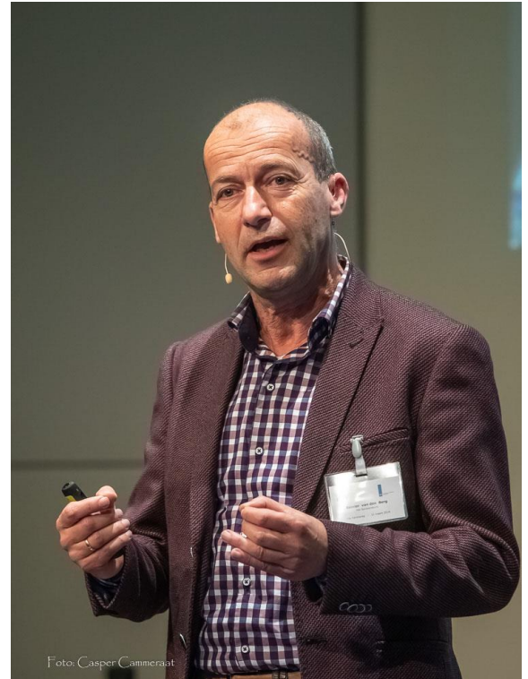
Reinier van den Berg

Na de pauze was het de beurt aan RTL-weerman Reinier van den Berg. Hij zette de gebeurtenissen van het afgelopen jaren in klimatologisch perspectief. Hij koppelde de gebeurtenissen van 2018 direct aan de oorzaken (volgens Van den Berg zonder enige twijfel de mens) en de effecten van klimaatverandering. De huidige klimaatdoelstellingen (opwarming beperken tot 1,5 graden Celsius) gaan we volgens hem nooit halen. In het huidige tempo van CO 2 -uitstoot gaan we daar al binnen vier jaar overheen. Volgens Van den Berg is het reeds 5 over 12. Maar we kunnen de klok nog teruggedraaien naar vijf voor. De oplossing? 'The power of trees', aldus de RTL-weerman. Hij legde uit wat hij daarmee bedoelde. Ontbossing is na het verbranden van fossiele energie de belangrijkste veroorzaker van de opwarming van de aarde. Bomen hebben voor hun groei CO 2 nodig (omzetting in hout en zuurstof) Maar hoe minder bomen, hoe minder CO 2 er wordt vastgelegd. Zijn oproep: massaal investeren in het planten van groen. Op deze manier kunnen we CO 2 uit de atmosfeer weer vastleggen, betogde Van den Berg. Meer informatie op www.treesforall.nl .