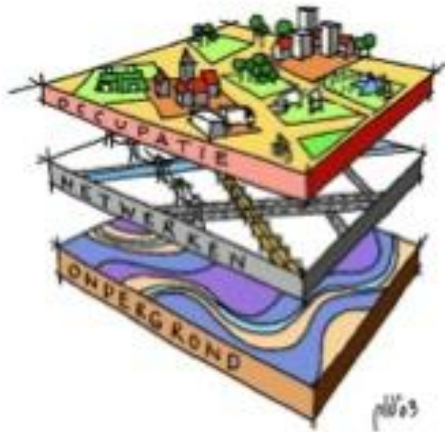
Figuur 1. De 3 lagen uit de lagenbenadering

2018) in voorbereiding is, is de lagenbenadering een belangrijk concept. Figuur 1 geeft de lagenbenadering schematisch weer.