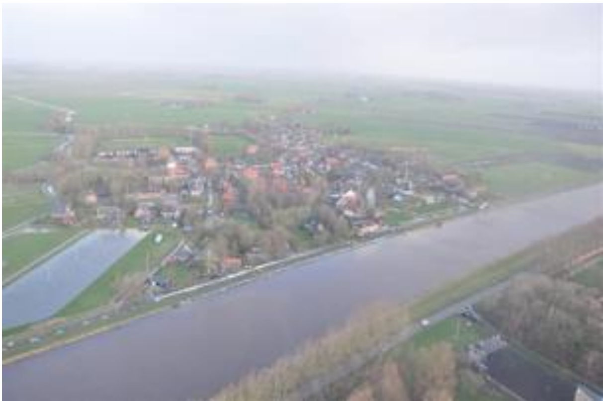
Foto: Woltersum bij hoogwater