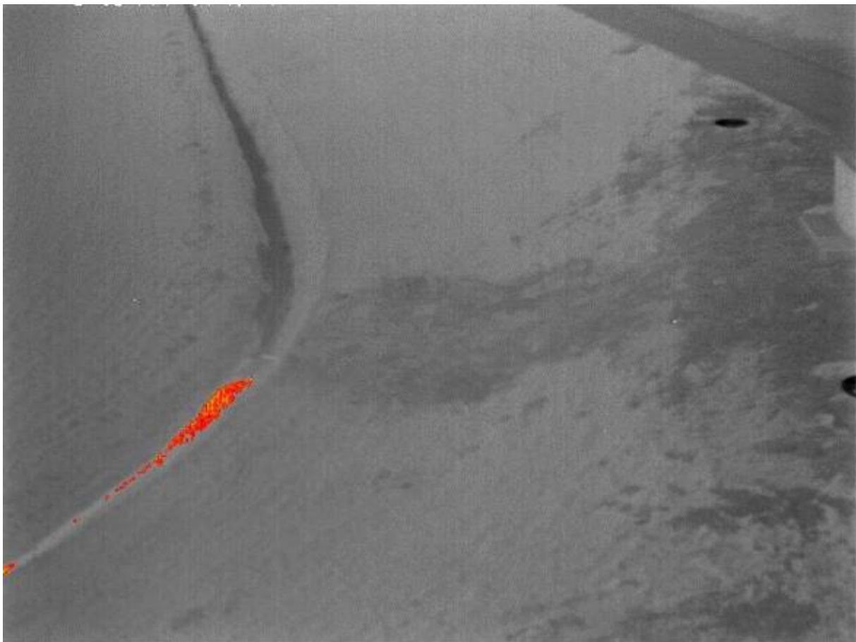
Uittredend water in een teensloot bij een dijk, gemeten met infrarood