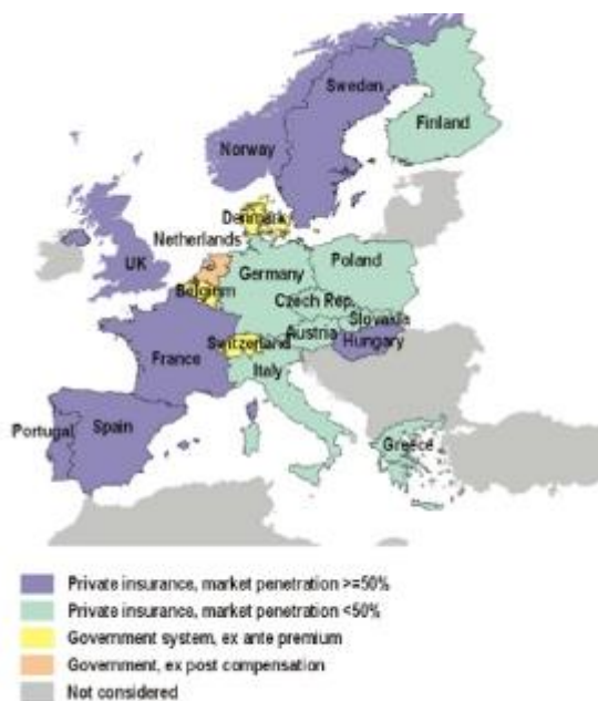
Figure 1. Overview of national flood insurance and compensation systems in Europe considered in this study.

Als argument om in Nederland tot een overstromingsverzekering te komen wordt vaak aangevoerd dat in de meeste westerse landen overstromingsschade verzekeraar is. Nu is dat op zich geen argument, maar het kan wel aanleiding zijn kennis te nemen van ervaringen in die andere landen; en daar voor Nederland relevante conclusies aan te verbinden.