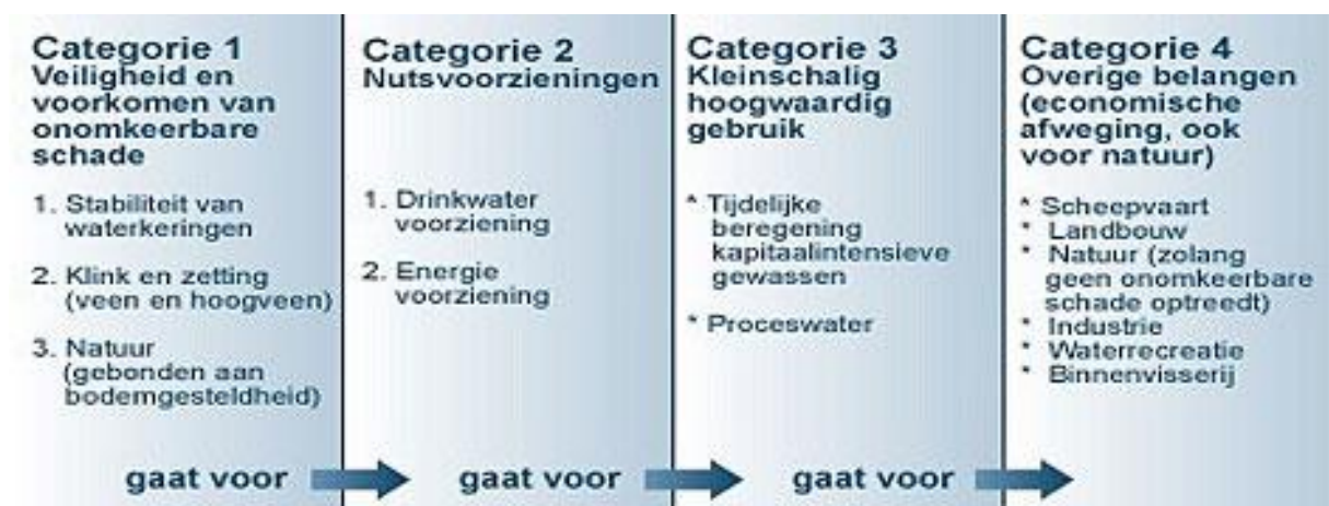
Figuur 1. De Nationale Verdringingsreeks (Bron: Nationaal Waterplan 2009-2015)

Wateropslag op het eigen perceel maakt de boer of tuinder minder afhankelijk van de hoeveelheid en kwaliteit van oppervlakte water uit sloot of kanaal waarvoor de waterbeheerder verantwoordelijk is. Door klimaatverandering neemt de kans op zomers met een (groot) neerslagtekort (droogte) toe en daarmee ook het risico op gewasopbrengstderving. Daarmee neemt de vraag naar water – ook uit andere sectoren – toe bij afnemende aanvoer van water vanuit de rivieren. De lage prioriteit