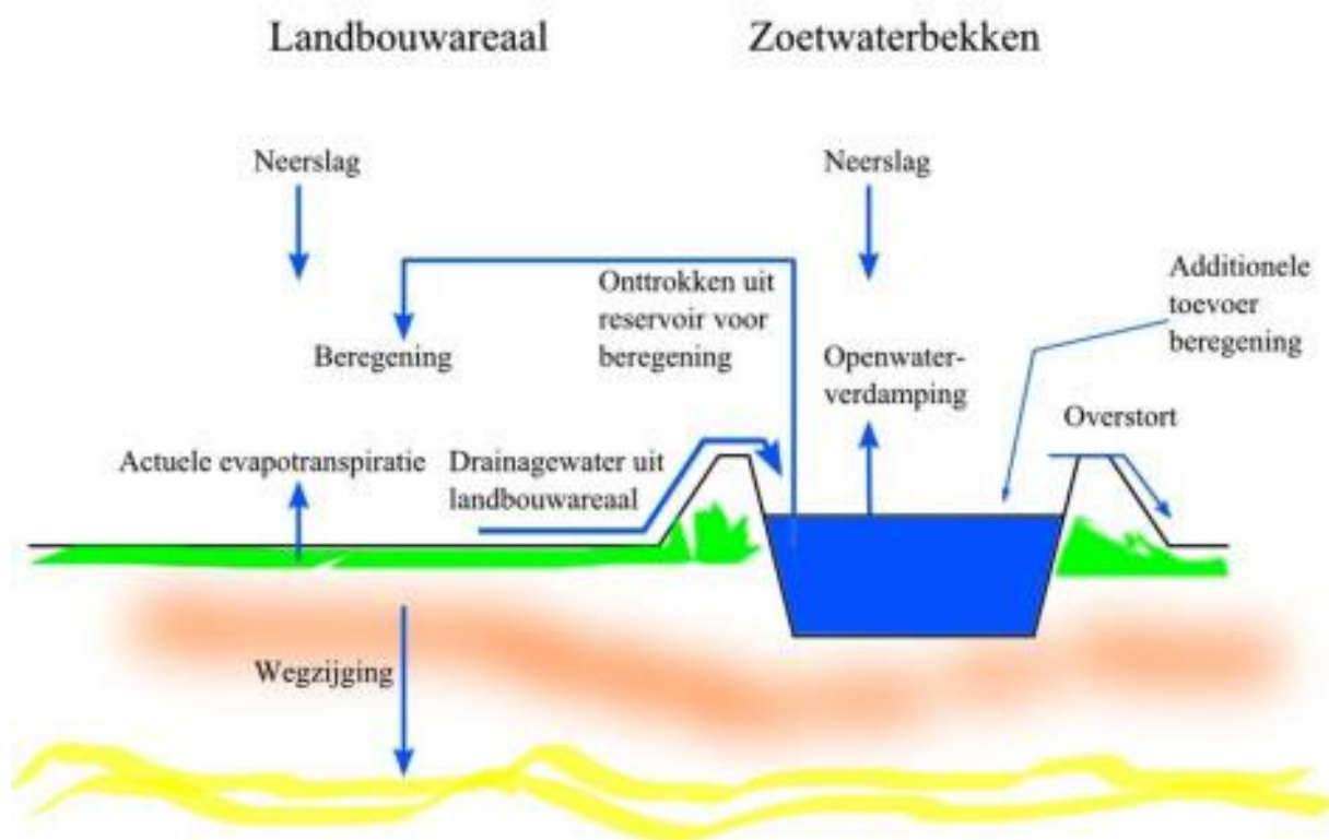
Figuur 3. Wateropslag bij open teelten

In de open teelt wordt gezocht naar een optimale vochtvoorziening voor het gewas door een optimaal grond- en oppervlaktewaterregime. In droge perioden vindt er aanvullende beregening vanuit grond- of oppervlaktewater plaats. Om minder afhankelijk te worden van wateraanvoer kan wateropslag op perceelniveau een oplossing zijn. Figuur 3 geeft een schematische weergave van wateropslag bij open teelten.