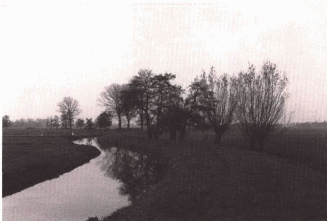
Foto: Kade in de Alblasserwaard met verschillende bomen op de kade

Het beoordelen van de waarde van bomen kan het best worden geïllustreerd aan de hand van twee voorbeelden: