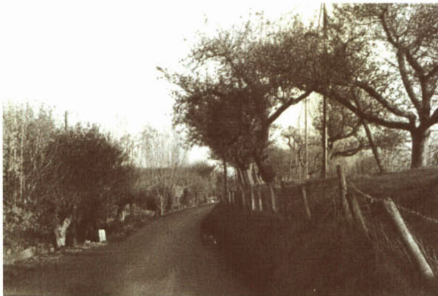
Foto: Na de aanleg van de stormvloedkering was de waterkering langs de Hollandse IJssel overgedimensioneerd. Was er toen meer ruimte voor andere functies?

verkeersafwikkeling, en hoeven 'vreemde objecten' niet meer als kunstmatig aanhangsel van de waterkering te worden beschouwd.