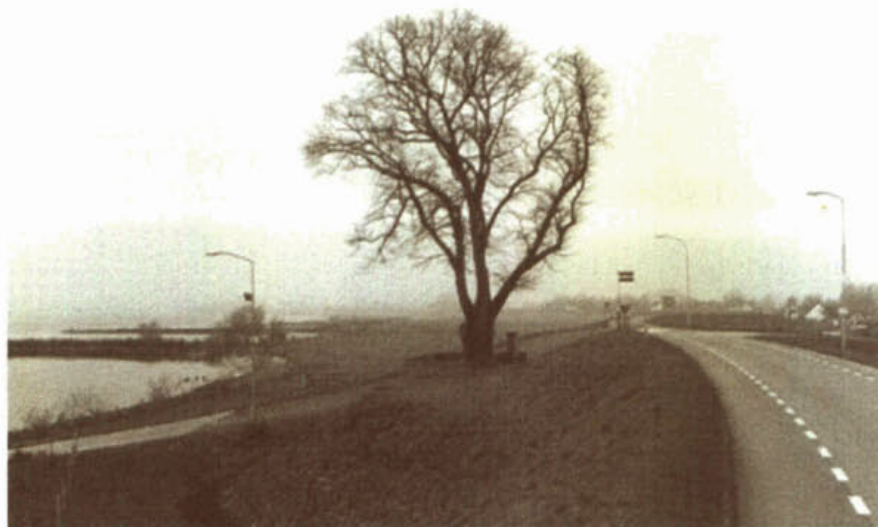
Foto: Een waardevolle boom op de versterkte waterkering die als 'vreemd object' is behandeld en zijn plaats heeft behouden (Vuren).