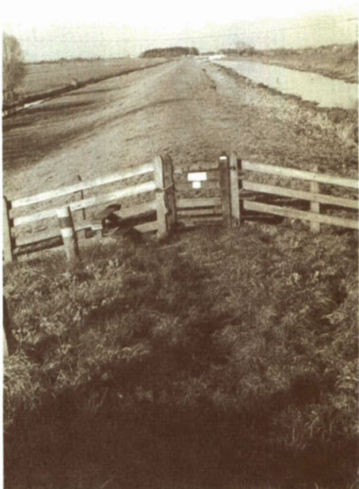
Foto: Zijdvang langs de Hollandse IJssel

Deze zijdvang hangt alleen samen met de verkaveling. Vlakbij is de waterkering van de Hollandse IJssel die zeer veel samenhang vertoont. Bomen op de zijdvang zijn niet nodig. Het is zo goed.