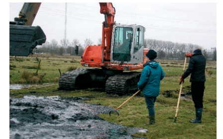
■ Al het redelijke doen...