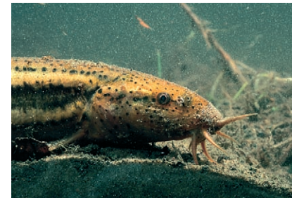
■ Grote modderkruiper

Voor de zwaarst beschermde categorie moet het waterschap bij ruimtelijke ingrepen altijd ontheffing aanvragen als schadelijke effecten te verwachten zijn. In dat geval is de gedragscode dus niet van toepassing. Als een waterschap met de gedragscode wil gaan werken, dan moet het bestuur dat kenbaar maken met een openbaar besluit.