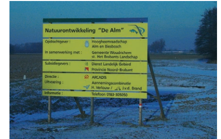
Voorzorgsmaatregelen nemen bij inrichting

De meeste sloten worden jaarlijks geschoond om de maatgevende afvoer te garanderen. Toch kan het gewenst zijn om schoningsbeurten een keer over te slaan, of de waterbegroeiing gedeeltelijk te laten staan. Bijvoorbeeld als beschermde vissen, amfibieën of libellen zijn gesignaleerd. Door het schoonsel of de bagger een paar dagen op de kant te laten liggen, krijgen kikkers en salamanders de gelegenheid terug te kruipen naar het water.