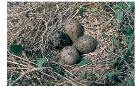
■ Buiten de broedtijd van vogels maaien