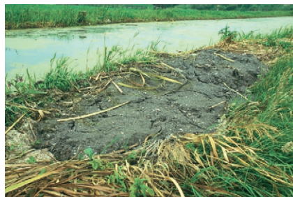
Bagger tijdelijk op de kant laten liggen