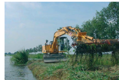
■ Duurzame werkwijze, bijvoorbeeld maaien met de maaikorf