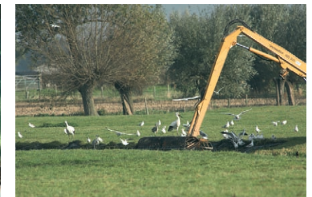
■ Schonen in nazomer en najaar