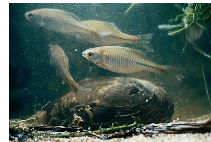
■ Bescherming van zoetwatermossels is belangrijk voor bittervoorns