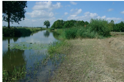
Een deel van de vegetatie laten staan