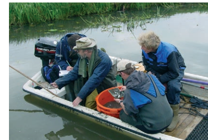
■ Veldonderzoek vooraf

Stel, op de werklocatie komen beschermde soorten voor of de kans daarop is groot. Het waterschap tracht dan in eerste instantie negatieve gevolgen voor flora en fauna te voorkomen door geen werkzaamheden uit te voeren in periodes waarin die soorten kwetsbaar zijn: bijvoorbeeld tijdens de voortplantingstijd, de winterrust of migratie. Zo is maaien in principe toegestaan vóór 15 maart en na 15 juli. De meeste vogels, amfibieën en reptielen hebben zich dan voortgeplant en planten hebben zaad kunnen zetten.